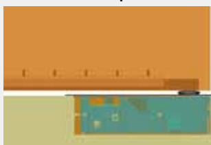
mit integriertem Türarm (nur 1401)