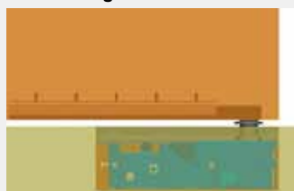
mit integriertem Türarm (nur 1401)