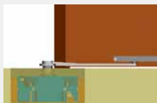
Gestänge ziehend (1401+1401.FIRE)